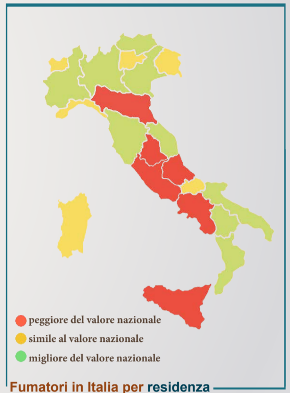
Fumatori in Italia per residenza