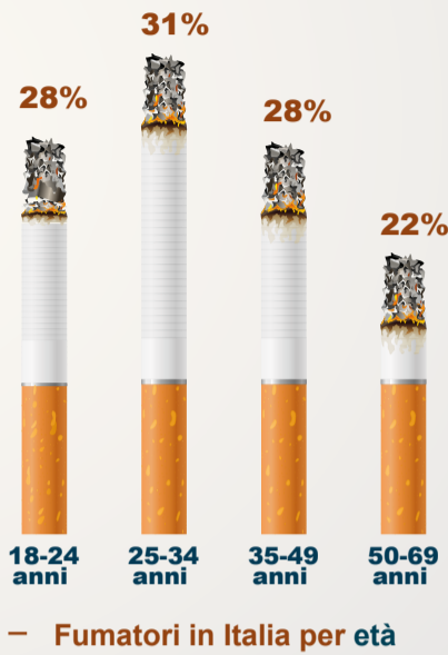
Fumatori in Italia per età